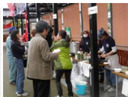
みたけラーメン実験販売