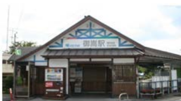
名鉄御嵩駅舎の修景