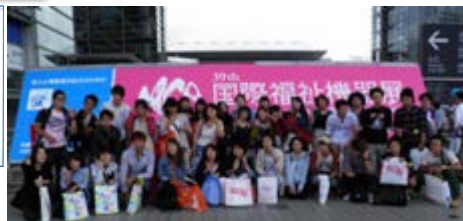
東京国際福祉機器展