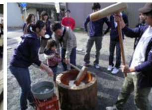
子どもたちと餅つき