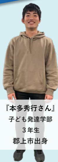
『本多秀行さん』 子ども発達学部 3年生 郡上市出身