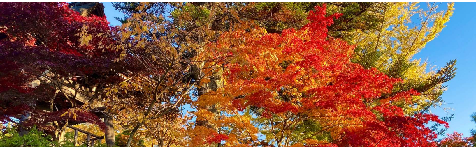
「高山市 | 東山遊歩道」