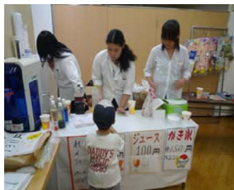
「ジュースください」