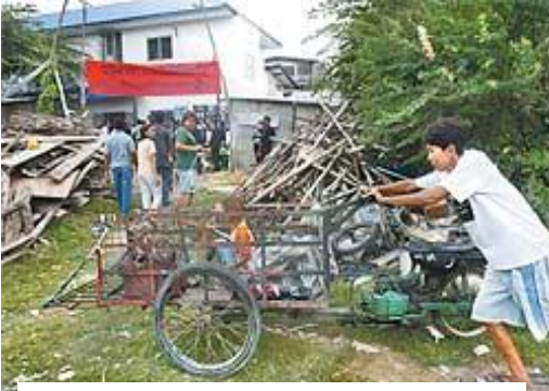
リサイクル業の家族とホームレスシェルター

都市でも、このような福祉基金が、スラムの居住環境改善と重ね合わせながら各所でみられるようになっていきます。とくに 1980 年代後半からグローバル資本によって高級マンションやショッピングモールへの再開発が進み、