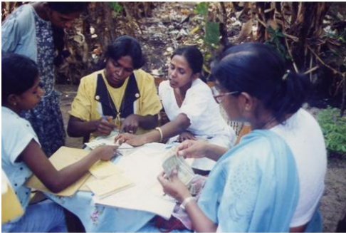
スリランカ「女性銀行」のスラムでの活動

しかし私どもの計画学における最大の関心事は、そういうことではなく、「もし融資を返せなくなった