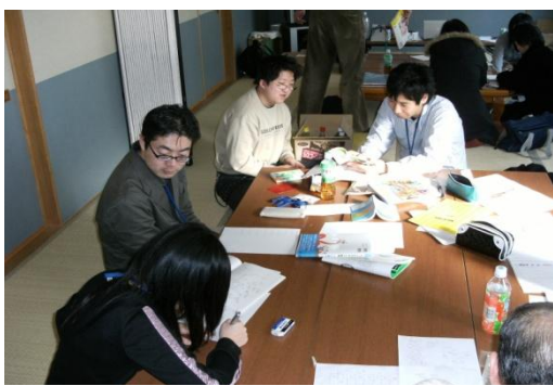
コミュニティハウスに集う子どもたちとチューター役のおとなたち

高知県にはユニークな制度があって、県のいろいろな部局出身の職員が「地域支援企画員」となって、行政のタテ割りを越えて市町村に派遣され、人々の地域おこしを手伝っています。この地区で働く企画員の方によれば、「グループの中で精米所のアイデアが出てきたときに、その精米所を基にして、村の人たちがどういふストーリーを作ろうとしているのかを一緒に議論しながら、それを支援しようとした」というのです。たんに施設基準として制度に合致しているかどうかを判定して「予算をつける」のではない、ということなのですが、この表現は印象的です。一人一人のストーリーを支えながら、共同の施設ができて、今までの伝統的な組織とは少し違ったところで新しい共同性が生まれます。一方で、県庁の職員全体の働き方のスタイルが少しずつ変わります。この米作りの場合は、大阪方面に出荷もするので、外との関係性も生まれ、イベントには学生たちが入って来たりします。こうした中で、さらに新しいアイデアが展開します。これは「福祉社会開発支援」のひとつの例だと思うのです。つまり、還元主義的な問題分析から始めない、ひとりひとりの自由なストーリーを支える「場」を地域の中に設定する、その中で関わり方のスタイルも変わっていく、ということです。