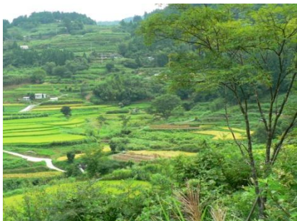
高知県大豊町の棚田

そこで私たちの立場は、日本も途上国も同じ土俵に立って意味ある比較や経験交流が可能なレベルまで問題を掘り下げた上で、地域の問題に対して一元的・一方的に対策を施すのではなく、現場の内外のさまざまなアクターの相互作用を通じて、地域社会の諸関係と、それを支えるマクロな制度基盤とを変化させ、地域の中に多様な福祉の仕組みを作り出すことです。制度が機能しない現代日本、またそもそも制度が存在しない国々で、ギャップの中から、新しい福祉の仕組みの担い手が生まれるような、そういう「地域社会」があるはずだと、私たちは考えています。「福祉社会」の開発とは、そのような地域社会を意識的、政策的につくりだすことです。そのときに、そうした動きに外から関わるワーカーも、一方的な支援でなく、ひとりのアクターとして変化しながら、地域の変化を呼び起こしていこう、と考えるのです。それが、これから議論する「福祉社会開発の支援ワーク」です。