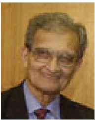
A. K. セン

参加とは、そういうマクロな枠組みで、システムがどう変わっていくかという文脈で考えるべきです。とすれば、問題を抱える人へのアプローチとして、「この人に何を与えるか」ということよりも、「この人の、必要なお金をお金を借りられるという人権、融資アクセスという自由は、なぜ制度的・社会的に抑圧されているか」に注目し、それを変える方向に働くこととなります。より具体的なアクションとしては、個人の意識を高めたり、能力を向上させる以前に、むしろ参加「機会」を提供する方向で、政策環境を整えるべきだ、ということです。