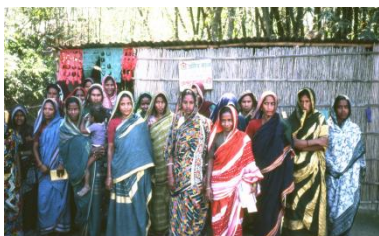
グラミン銀行の女性借り手グループ

私たちは、「参加」をミクロな枠組みで考えることが多いように思います。いままで声を挙げにくかった女性たちも村の集会で発言して事業に参加する、といった場面では、「参加の促進」がファシリテーション技法などによって、さまざまに図られたりします。しかし、より本質的には、排除される人びとは、市場から、制度から、政治的意思決定から、排除されているのです。すると「参加」のためには、マクロなシステムの方が変わらなくてはなりません。