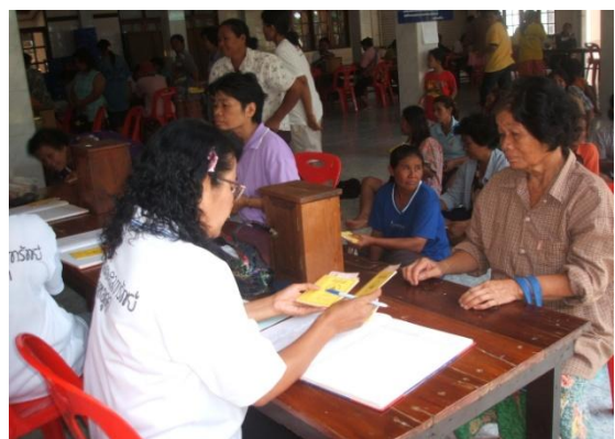
寺の境内で行われている村人同士の貯蓄融資活動と福祉基金の積み立て

住民による福祉基金への出資額は、ほとんどの村で、政府の提供した当初資金の3倍にも4倍にもなっています。こうした実例から、私たちは「福祉社会開発の支援」