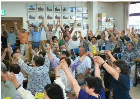
知多半島武豊町の高齢者サロン

これに対して、コミュニティソーシャルワークは、クライアント諸個人の抱える問題を地域の特性や社会関係にさかのぼって把握し、地域社会の変容を通じるなどして個別の問題を解決しようとするものとされています（2）。予防医学分野では、「ハイリスク戦略」と「ポピュレーション戦略」の関係が議論されています。疾患を発症しやすい高リスクの個人を対象に医療技術的なインプットを集中するハイリスク戦略は、リスクが集団内の一部に限られて特定され、長期的に有効な介入方法が確立しているよ