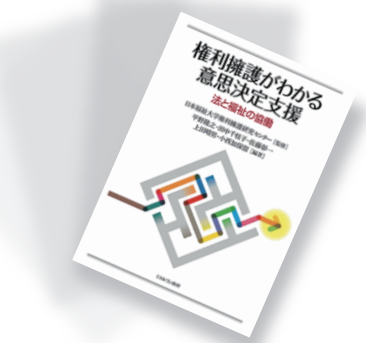
『権利擁護がわかる意思決定支援 法と福祉の協働』(ミネルヴァ書房)