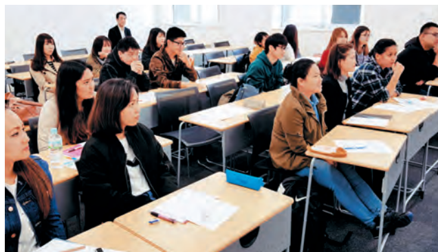
留学生の最初の日本語の授業風景