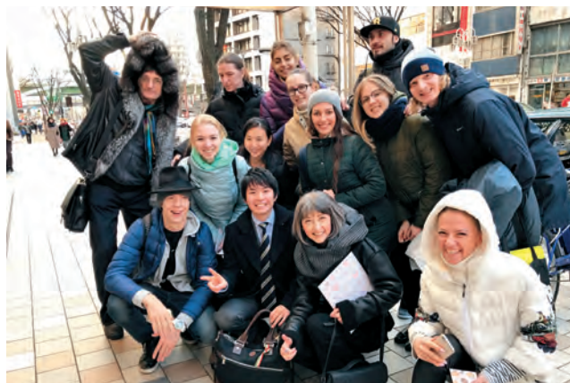
ロシア人の日本観光アテンド時

大学でのこのような経験は、今の社会人生活の中でも活かされています。私は、名鉄観光サービスで働き