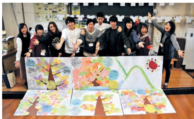
加子母中学校でのワークショップ終了時の集合写真