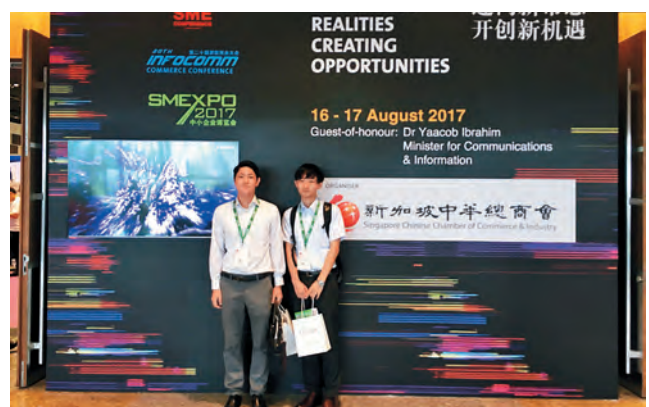
中小企業が集まるビジネス展示会にて