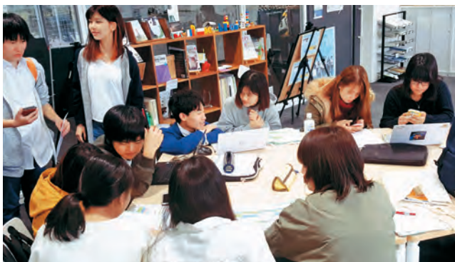
グローバルラウンジで、サポート学生が履修登録を手伝っている場面

入学直後のオリエンテーションのときから、留学生の皆さんは毎日大量に提供される日本語の情報を処理するのに格闘している間、日本語教育プログラムを受講している新 2 年生約 20 人がサポーターとして立ち上がってくれました。諸々の書類の記入、履修登録のアドバイス、また大学の勉強の手伝いをし、日本語学習者に対してどのようにコミュニケーションをとるか、やさしい日本語を使ってどのように複雑な話をわかりやすく説明するかについていろいろ挑戦しました。皆さんのおかげで、留学生はとてもいいスタートを切ったようで、やる気满满で授業に取り掛かることができました。これから週 1 回、2 年生と一緒に日本語教育センターで留学生の学習サポートが続く予定です。興味のある方は一度遊びに来てください！