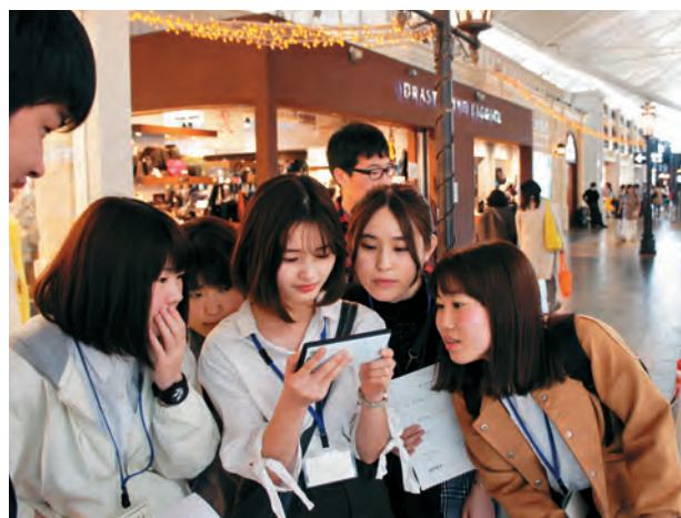
空港内でのアクティビティで 教員からのクイズ問題を熱心に解いている新入生たち