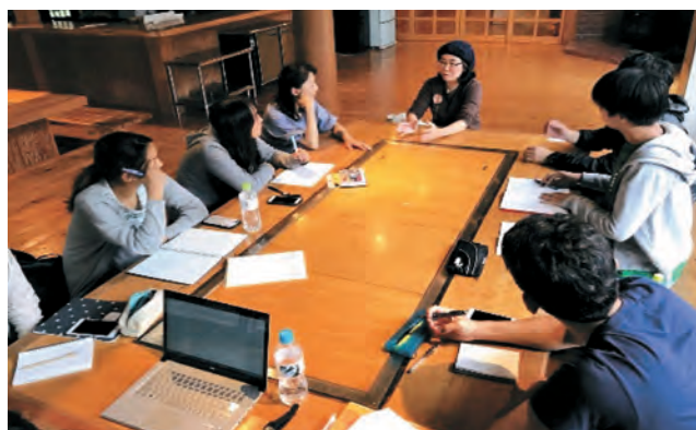
移住者の方へのインタビュー風景