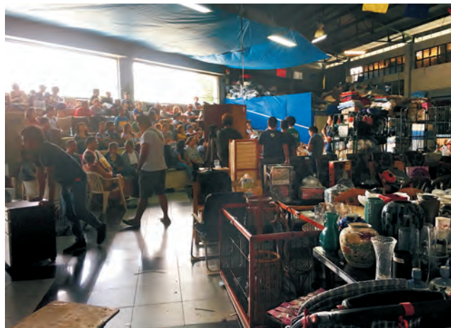
運ばれてきた日本製品を競り落とすオークション会場

昨年からは本格的に始まったアクティブラーニング期間を利用して、現在、フィリピン北部の町で約半年間フィールドワークを行っています。皆さんは、日本の廃品回収業者を目にしたことがありますでしょうか？自宅近辺を軽トラックで回り、使わなくなった家具、テレビ、パソコン、バイクなどを無料で回収する業者があります。私は、常々疑問に思っていたことがあります。日本では、ゴミを捨てるのにお金がかかるにも関わらず、廃品回収業者は、無料で引き取ってくれます。なぜ無料で引き取れるかその実態を、フィリピンで調査して初めて分かりました。廃品回収業者は、集めた廃品を大型コンテナに乗せて、フィリピンなどの国で売りつけていました。確かに、日本で使わなくなった家具などは、再利用することができ環境にも良いでしょう。しかし、問題も多々あります。廃棄するのに困難な、自動車のバッテリーなども大量に運ばれてきます。一見、聞こえはいいと思いますが、日本の廃品回収業者は、「ゴミ」も一緒に送りつけているという実態です。日本の中古品を販売している