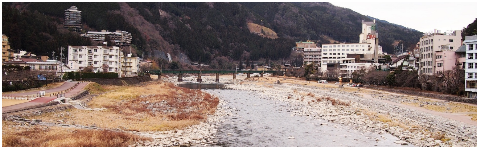
「下呂大橋から見た飛騨川」