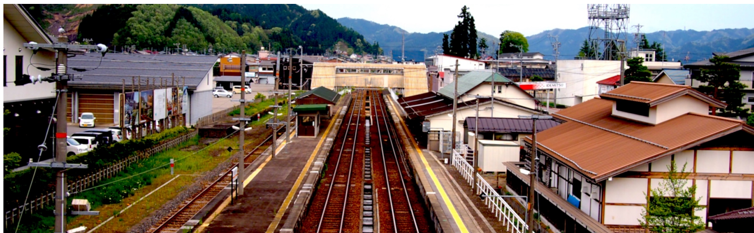
「飛騨古川駅」