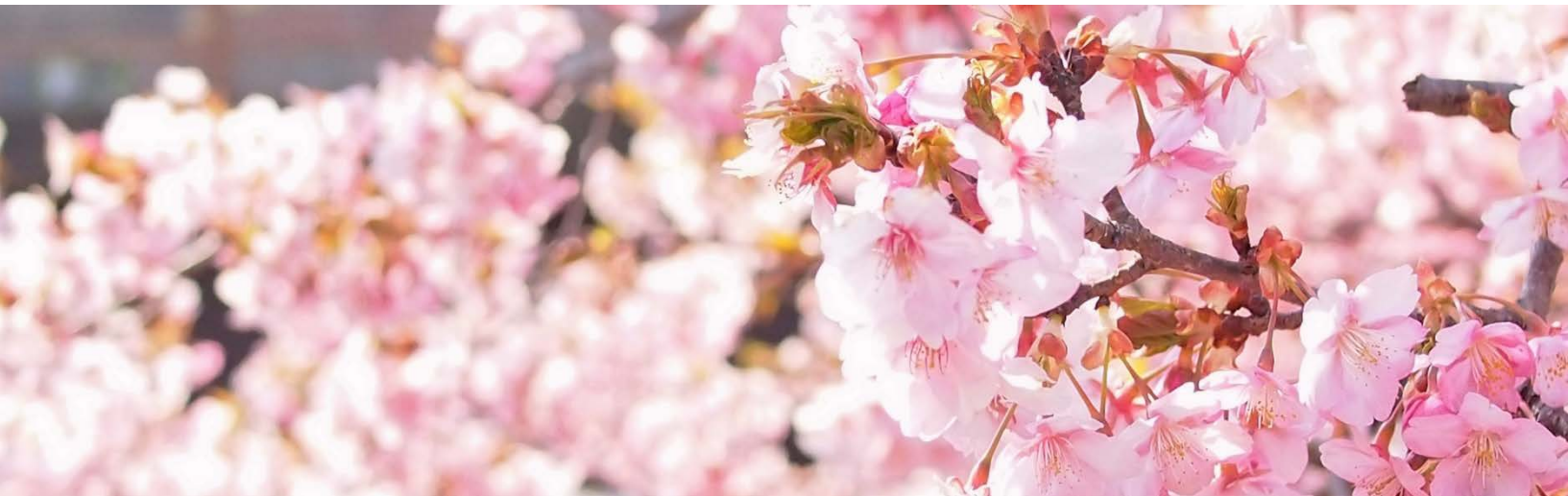
「上石津町牧田川の桜」