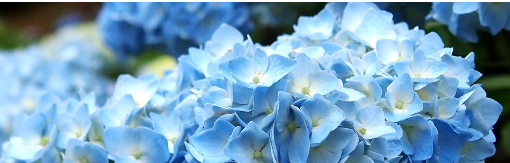
「関市21世紀の森公園」